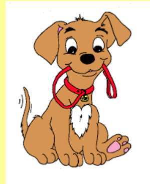
σ κ ύ λ ο ς