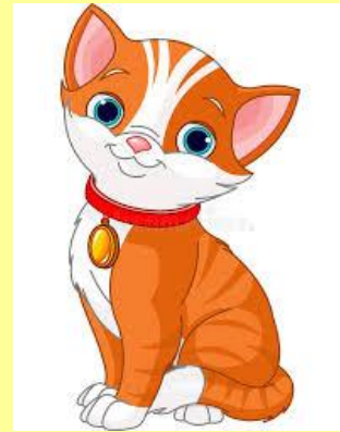
γ ά τ α