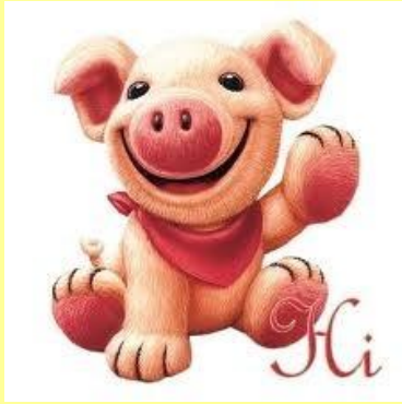
γ ο υρ ο ύ ν ι