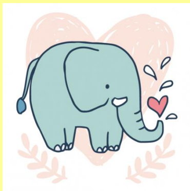
ε λ έ φ α ν τ α ς