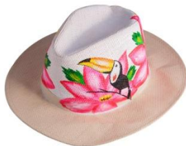
κα πε λό