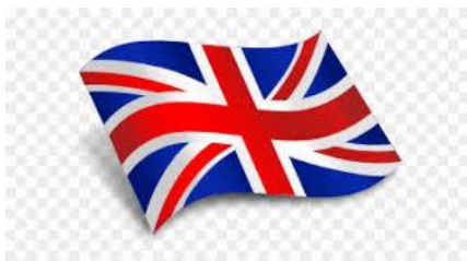
United Kingdom (UK)